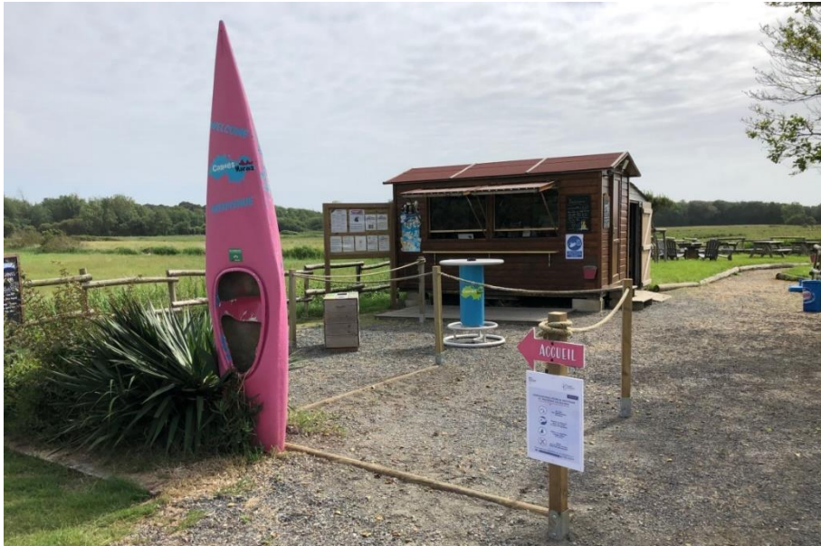
Arrivée sur la base, en direction de l'accueil