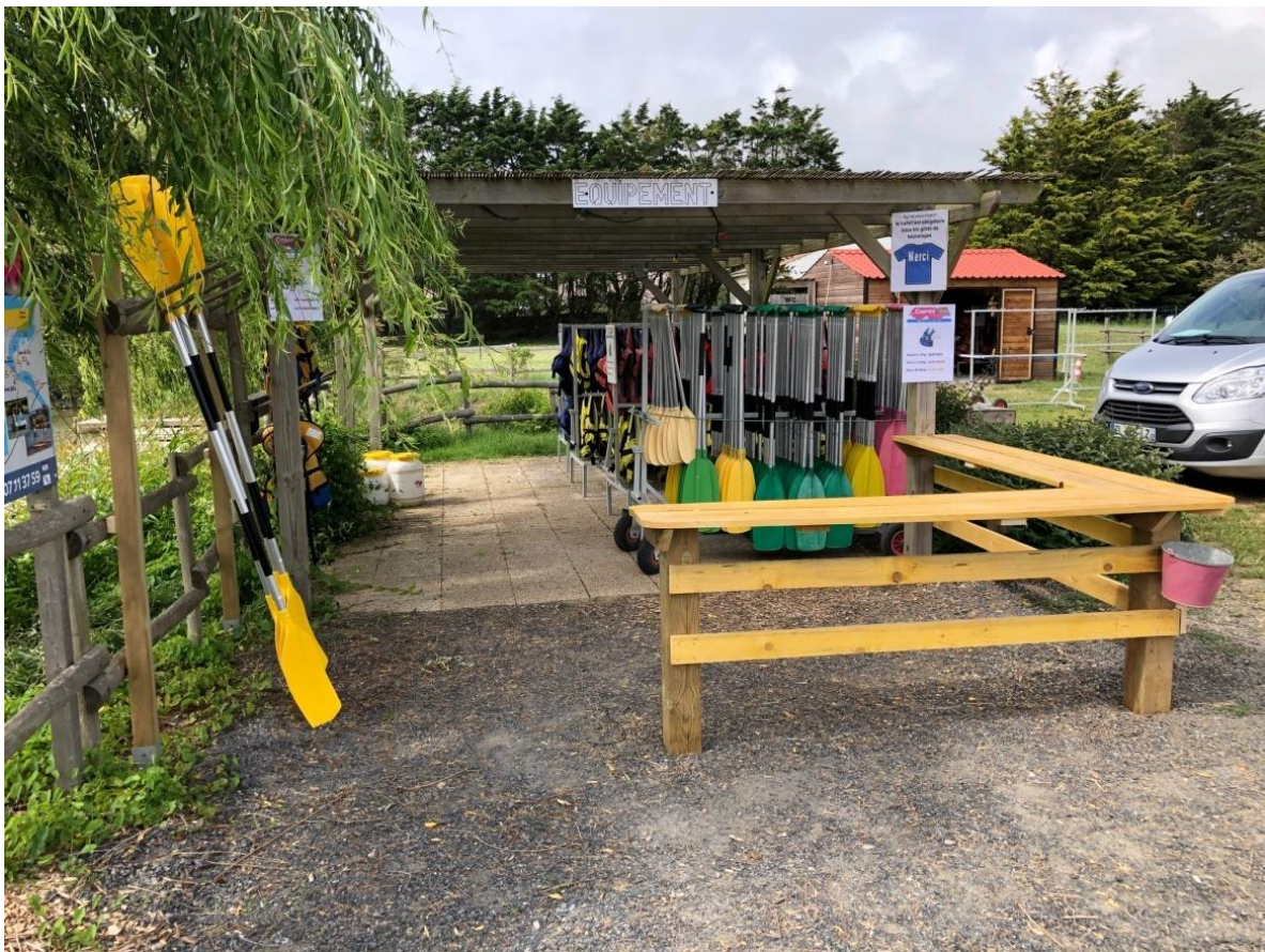
Zone de stockage du matériel « propre », avec un comptoir pour délimiter la zone et limiter les contacts