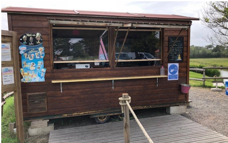
Accueil avec plexiglas et gel hydroalcoolique à disposition du public