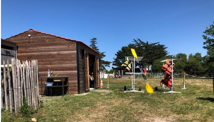
Zone attribuée au retour du matériel, avant désinfection